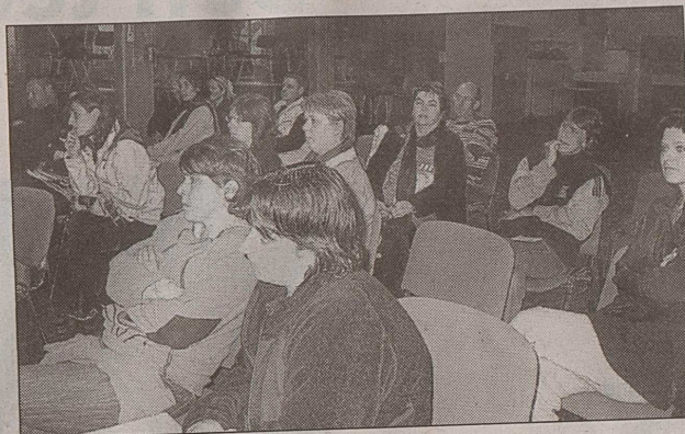
Les parents de Loqueffret et de Brennilis, lors de la réunion, jeudi soir, à la salle polyvalente.

Les parents sont, tout de même, inquiets et se posent de nombreuses questions sur « la réparti-