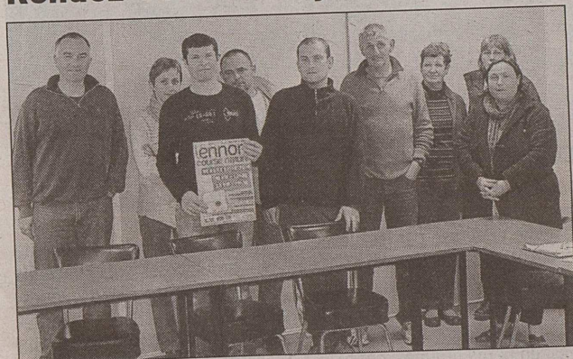
La dernière réunion de préparation du comité d'animation aura lieu lundi, à 20 h 30, à la mairie.

Le vendredi 18 juin, la commune inaugurera une nouvelle activité : une course nature qui aura lieu en semi-nocturne, au départ du bourg.