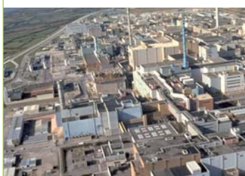
L'usine de La Hague (Manche)

Les principaux rejets de tritium de fission sont le fait des usines française et anglaise de retraitement des combustibles irradiés lors de la mise en solution liquide du combustible. Cette opération chimique rejette du tritium dans l'air et dans la mer. En France, l'usine de La Hague (Manche) en rejette annuellement la plus grande quantité (23 g, soit 8 236 TBq, pour une limite fixée à 40 g).