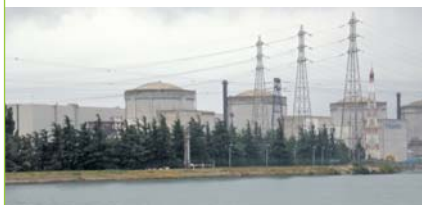
La centrale nucléaire de Tricastin qui comprend 4 réacteurs de 900 MW, rejette environ 45 Tq de tritium par an.

Les centrales nucléaires produisent du tritium, formé par la fission de certains isotopes de l'uranium et du plutonium, et par des réactions neutroniques sur des éléments légers du circuit primaire de refroidissement (bore, lithium). Dans le premier cas, le tritium reste pour l'essentiel dans le combustible lui-même (environ 87%) et dans les gaines de combustible (environ 13%).