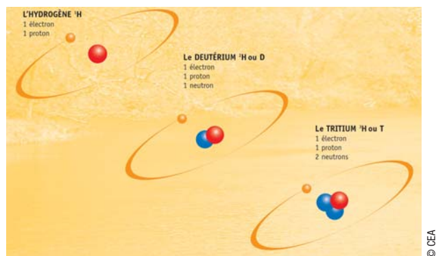
Les trois isotopes de l'hydrogène

Le tritium est l'un des trois isotopes de l'hydrogène (les isotopes d'un élément chimique ont le même nombre de protons et d'électrons mais différent par le nombre de neutrons) :