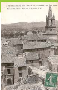
Carte postale du séisme du 11 juin 1909.