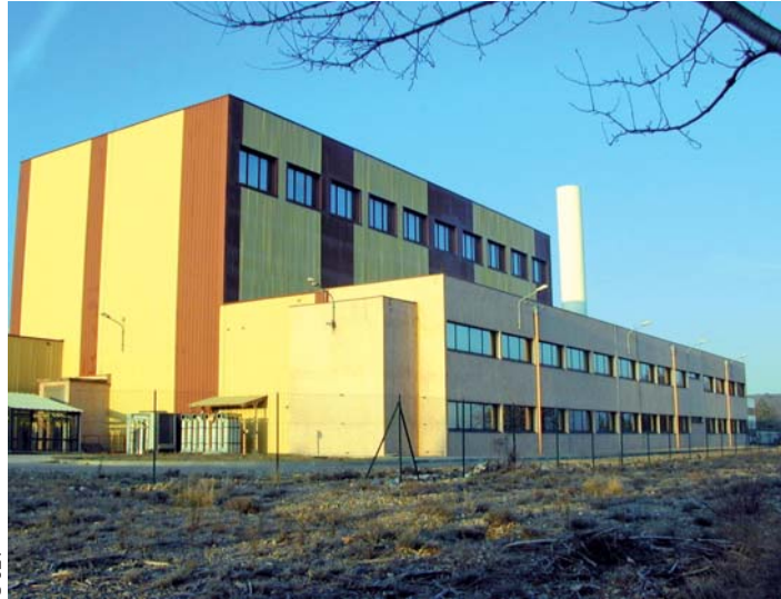
LECA-STAR est actuellement à Cadarache l'installation qui bénéficie de l'autorisation de rejet de tritium la plus élevée.

Le 3 octobre 2008, la CLI a organisé à Jouques une réunion publique d'information sur le tritium. A la suite de cette réunion, elle a décidé de publier le présent dossier.