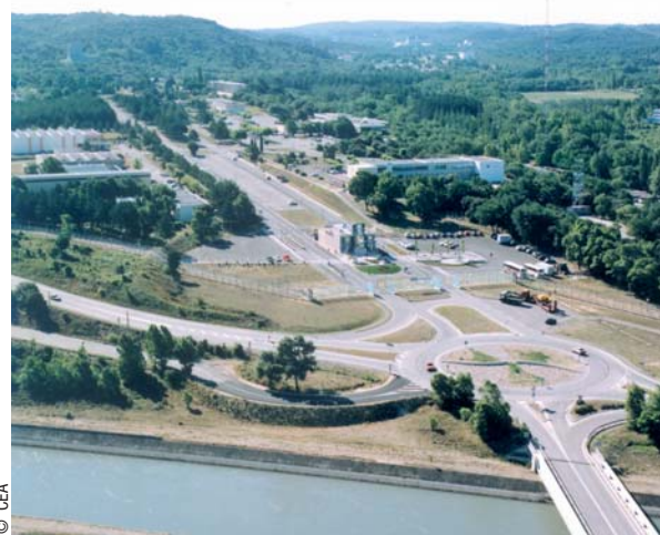
L'entrée principale du site du CEA/Cadarache.

Du 20 avril au 20 mai 2009, le public pourra ainsi consulter le dossier de la demande et porter ses observations sur le registre mis à sa disposition dans les mairies des communes de Saint-Paul-lez-Durance, Jouques, Rians, Ginasservis, Vinon-sur-Verdon, Corbières, Beaumont-de-Pertuis et Mirabeau.