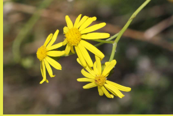
Séneçon du Cap