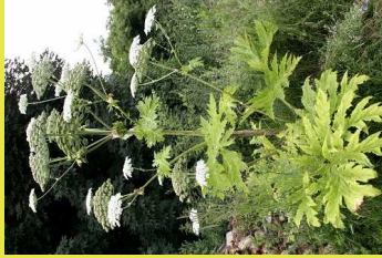
Grande berce du Caucase