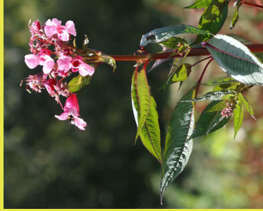
Impatiens de l'Himalaya