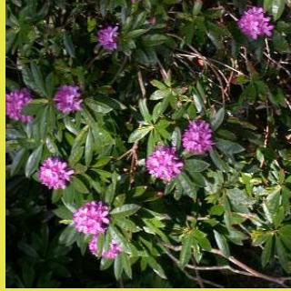
Rhododendron des parcs