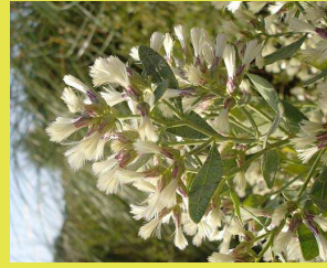
Séneçon en arbre