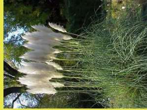
Herbe de la pampa