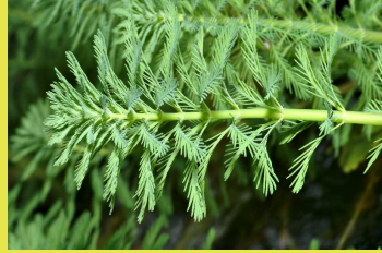
Myriophylle du Brésil