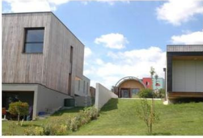
Eco-quartier de la Pellinière