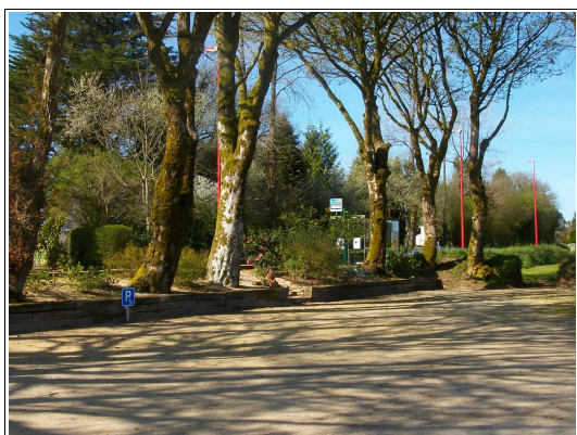
Panneau salle polyvalente