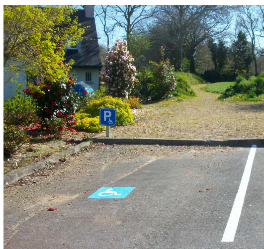
Panneau accès jeux Park Tost

BRENNILIS - PLACES DE STATIONNEMENT RÉSERVÉES VÉHICULES PERSONNES HANDICAPÉES