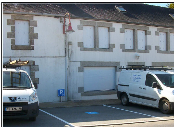
Panneau face à l'église