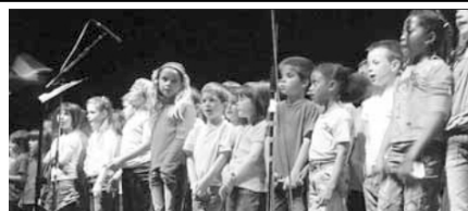
RENCONTRE CHORALE DES ÉCOLIERS

Festival organisé à Huelgoat le samedi 16 juin à partir de 14 heures sous l'égide de la FALSAB, 27 jeux traditionnels, accès libre. À 19 heures, sanglier grillé (12 € par personne).