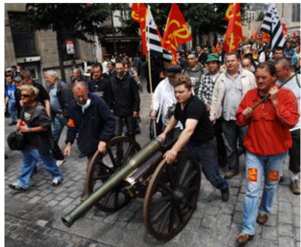
Aujourd'hui, à Quimper, c'est la réplique d'un canon napoléonien qui ouvrait le cortège des défenseurs de l'hôpital de Carhaix.

Le prochain rendez-vous sera celui du 20 juin à l'ARH, à Rennes. Une action est d'ores et déjà prévue samedi prochain 21 juin à Quimper. Les élus du Poher avec leurs écharpes devraient se joindre au cortège des manifestants.