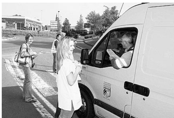
Les barrages filtrants ont été plutôt bien accueillis par les automobilistes.

Les défenseurs des hôpitaux publics ont appelé à la « mobilisation » et à la « résistance » pour que « la Bretagne ne devienne pas un désert sanitaire ». Ils ont également invité la population à manifester à Rennes, devant l'Agence régionale d'hospitalisation (ARH, l'autorité de tutelle dépendant du ministère de la Santé) le vendredi 20 juin, à partir de 14 h.