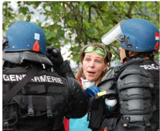
Les manifestants quadrillent le quartier de la préfecture depuis 8h ce matin.