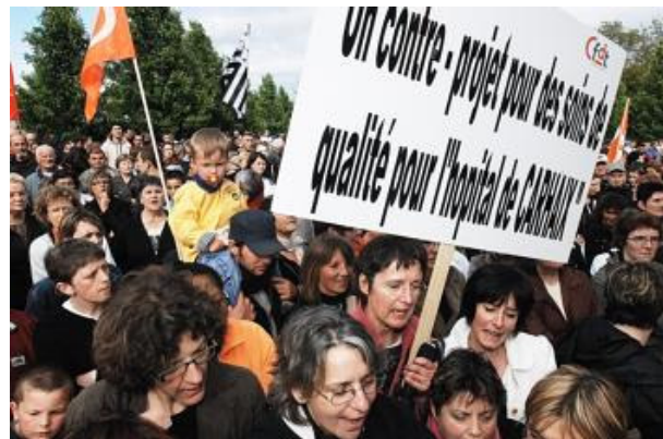
Hier, près de 3.000 personnes ont manifesté leur colère après l'annonce de la décision du directeur de l'Agence régionale d'hospitalisation.