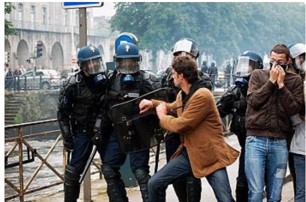
Quelque 700 manifestants ont investi les rues de Quimper, hier. Cette manifestation devrait être la première d'une série prévue toute la semaine.

Une heure plus tard, les premières blouses blanches apparaissent sur les bords de l'Aulne. Objectif de l'étape : la permanence de Christian Ménard. Le député UMP, défenseur historique de l'hôpital de Carhaix, a tenu l'après-midi même des propos jugés ambigus sur France 3 Ouest, qualifiant la proposition de Roselyne Bachelot « de moindre mal ». La réaction ne s'est pas fait attendre : pneus brûlés devant la façade, plaque d'identification détruite, locaux investis, souvenirs photographiques brûlés, tracts de campagnes éparpillés au vent... Les manifestants ont tenu le siège jusqu'à 18 h 30 en espérant une conférence téléphonique avec le ministère. Conférence qui ne viendra pas. Lassés, les Carhaisiens ont alors décidé de rallier la capitale du Poher pour réfléchir aux prochaines actions à mener. Non sans s'octroyer un détour par Châteauneuf-du-Faou, le fief de Christian Ménard, afin d'exprimer leur déception par un ultime feu de pneus. La semaine promet d'être longue.