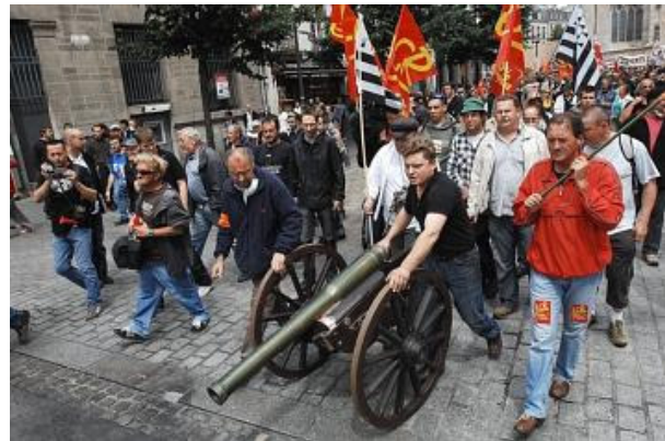
Après la catapulte, le comité de défense de l'hôpital de Carhaix a fait « tonner » la réplique d'un canon napoléonien, hier, à Quimper.