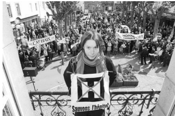
Une maternité et un service de chirurgie menacés de fermeture, et c'est tout un pays qui se soulève. Depuis fin mars, les manifestations se succèdent à Carhaix, mais aussi à Châteaulin, Quimper ou Morlaix.

Chaque manifestation est suivie, en direct, depuis Paris. Du côté des autorités, pas question de toucher aux représentants du mouvement. Pas question d'en faire des « martyrs ». On joue l'apaisement. Le pourrissement ? Pari difficile, d'autant que la tension monte. Le mouvement, à force de cibler Quimper et Châteaulin, perd une partie de son capital sympathie auprès du public. Les commerçants, qui ne voient plus aucun client, sont exaspérés. Les Carhaisiens, échauffés par les contradictions quotidiennes de l'ARH. Qui remportera ce bras de fer ? « Nous ne plions