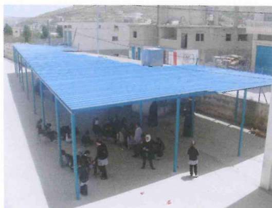
Le préau de l'école de filles