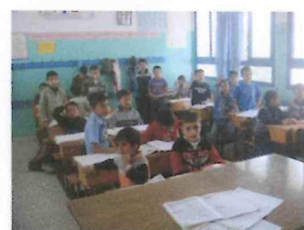
Deux classes de l'école de garçons