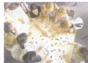
Children / Enfants