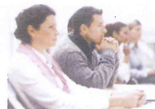
Adults / Adultes